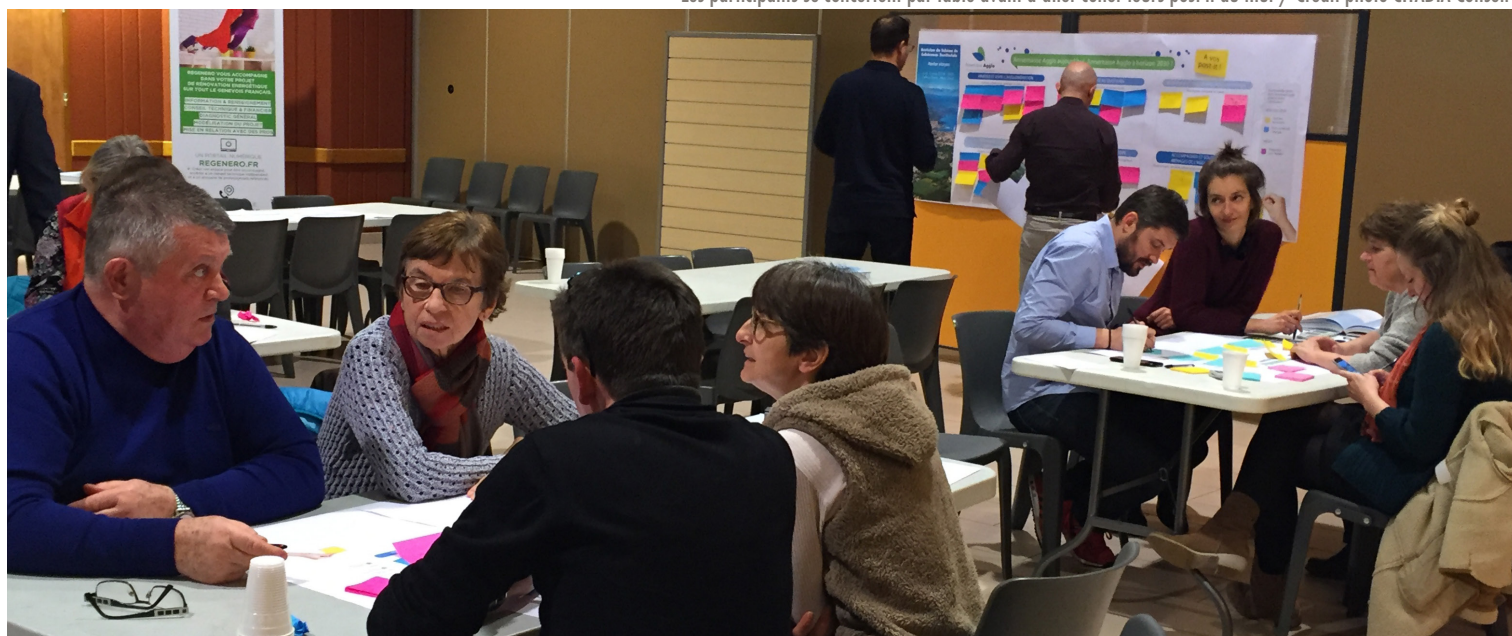
Les participants se concertent par table avant d'aller coller leurs post-it au mur

dans une certaine mesure la préservation des paysages et de l'environnement. Les propositions faites pour demain concernent la thématique agricole. Elles renvoient à l'idée de développement des circuits-courts pour encourager la consommation alimentaire locale (distribution directe, associations pour le maintien d'une agriculture paysanne, par exemple). Par ailleurs, plusieurs participants proposent la préservation du support agricole par la densification des zones artisanales.